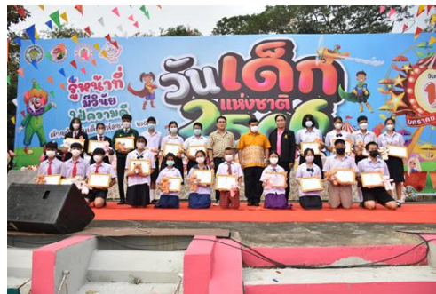
๓. ศึกษาธิการจังหวัดชัยนาทอ่านรายชื่อ เด็กและเยาวชนดีเด่น