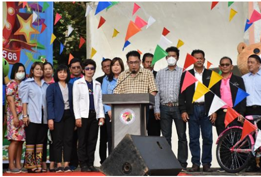
๑. นายกองค้การบริหารส่วนจังหวัดชัยนาท กล่าวรายงาน