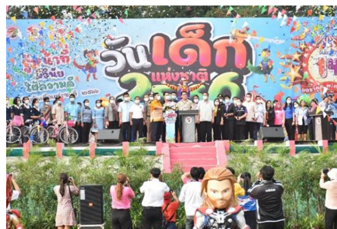
๒. ผู้ว่าราชการจังหวัดชัยนาท ประธานในพิธี อ่านสารวันเด็กแห่งชาติ และกล่าวเปิดงาน