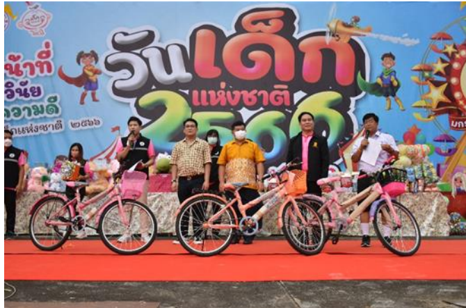
๕. ผู้ว่าราชการจังหวัดชัยนาท หัวหน้าส่วนราชการ จับสลากแจกของรางวัล “เด็กดี มีรางวัล” จากการลงทะเบียนเข้างาน”