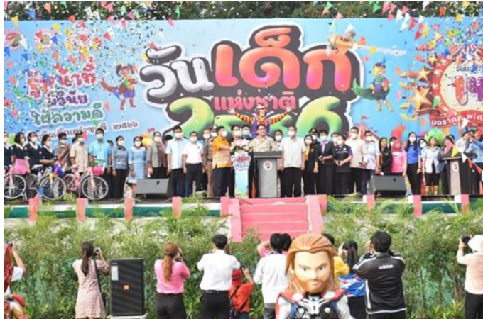
๒. ผู้ว่าราชการจังหวัดชัยนาท ประธานในพิธี อ่านสารวันเด็กแห่งชาติ และกล่าวเปิดงาน