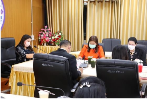
ภาพการจัดประชุมคณะกรรมการฯ

๑๔. ภาพกิจกรรมที่เกิดขึ้นภายในโครงการ / กิจกรรม (ที่สื่อถึงการดำเนินการสู่ความสำเร็จ จำนวน ๕ ภาพ ขนาด file เท่ากับหรือมากกว่า ๒ MB)