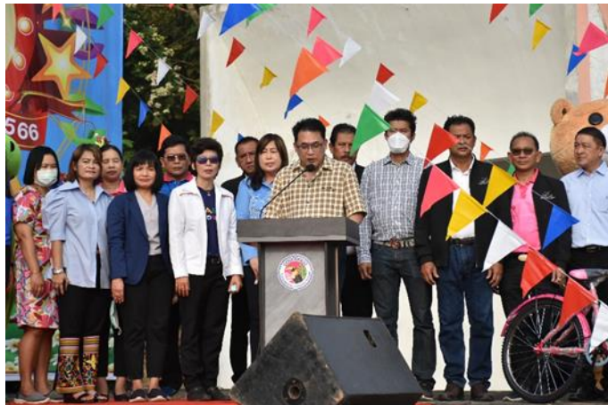
๑. นายกองค้การบริหารส่วนจังหวัดชัยนาท กล่าวรายงาน