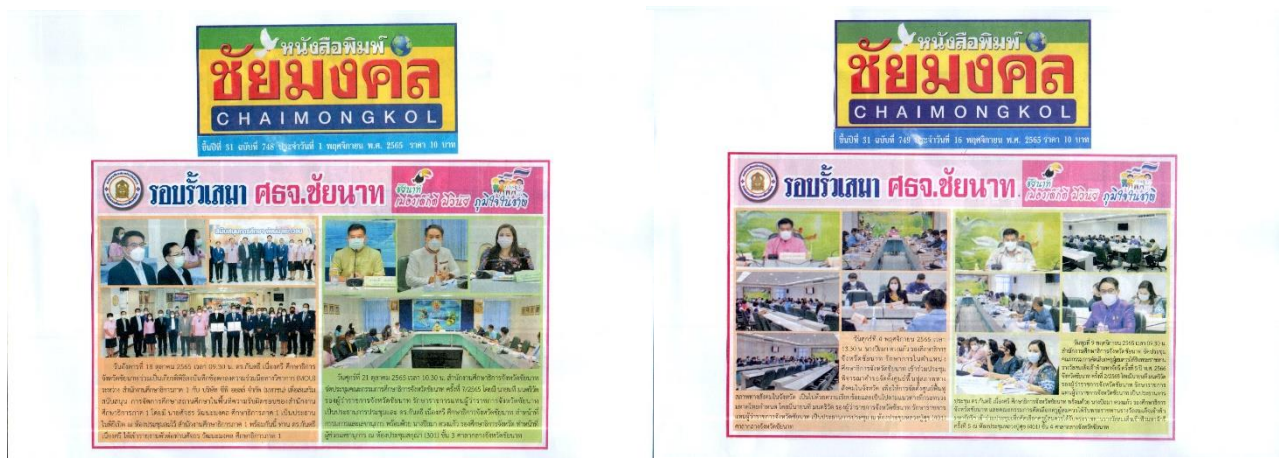
ภาพกิจกรรมเผยแพร่ข่าวสารทางหนังสือพิมพ์ท้องถิ่น