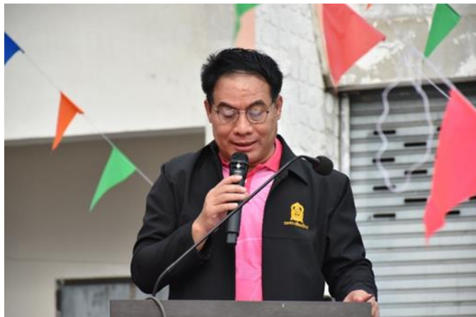
๓. ศึกษาธิการจังหวัดชัยนาทอ่านรายชื่อเด็กและเยาวชนดีเด่น