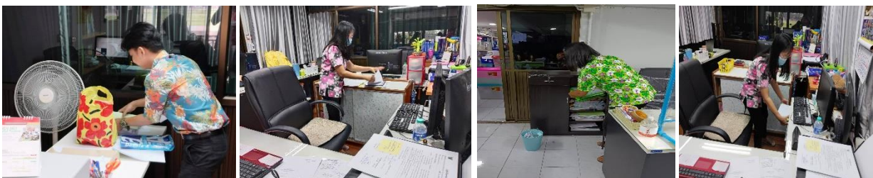
ภาพกิจกรรม ๕ ส (ครั้งที่ ๑)