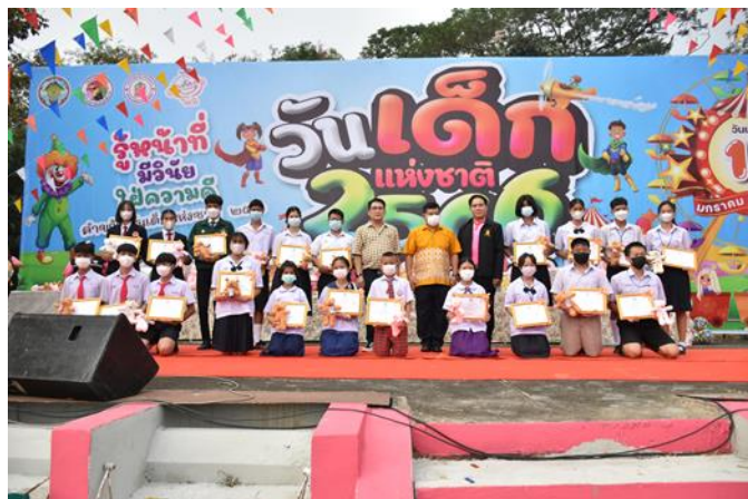
๔. มอบเกียรติบัตรให้แก่เด็ก และเยาวชนดีเด่น