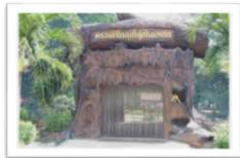
กรงนกขนาดใหญ่

2) เขื่อนเจ้าพระยา เป็นเขื่อนเพื่อการชลประทานขนาดใหญ่ที่สร้างขึ้นเป็นเขื่อนแรกของประเทศไทย ลักษณะเขื่อนมีความยาว 237.50 เมตร มีช่องระบายน้ำ 16 ช่อง มีประตูเรือติดกับเขื่อนด้านขวา กว้าง 14 เมตร ให้เรือขนาดใหญ่ผ่านเข้าออกได้ เขื่อนเจ้าพระยาเป็นเขื่อนชลประทาน ประเภททดน้ำ-ส่งน้ำ และผลิตกระแสไฟฟ้าในกิจการของเขื่อน เป็นสถานที่ท่องเที่ยวที่ยังมีทิวทัศน์สวยงามมากเป็นเขื่อนที่นักท่องเที่ยวสามารถเข้าไปชมอย่างใกล้ชิดได้ โดยเฉพาะในช่วงเดือนกุมภาพันธ์ของทุกปีจะมีคนเปิดน้ำจำนวนนับหมื่นตัวมาอาศัยอยู่บริเวณเหนือเขื่อน