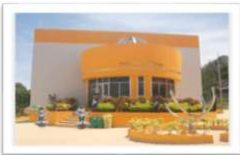
ศูนย์วิทยาศาสตร์ท้องฟ้าจำลอง