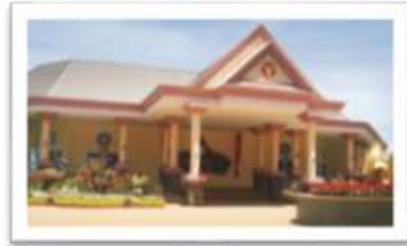
อาคารแสดงพันธุ์ปลา