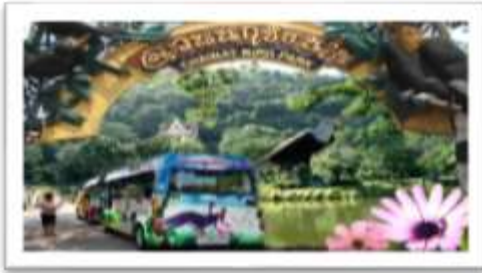
สวนนกชัยนาท

1) สวนนกชัยนาท เป็นสถานที่ท่องเที่ยวและอนุรักษ์พันธุ์นกที่ได้รับเริ่มขึ้นเมื่อปี 2526 ตั้งอยู่บริเวณเชิงเขาพลอง หมู่ที่ 4 ตำบลเขาท่าพระ อำเภอเมือง จังหวัดชัยนาท ปัจจุบันมีพื้นที่ 248 ไร่เศษ เป็นแหล่งท่องเที่ยวที่สามารถสร้างรายได้และชื่อเสียงแก่จังหวัดชัยนาทเป็นอย่างมาก โดยมีองค์ประกอบที่ได้สร้างขึ้นให้มีสภาพเป็นธรรมชาติและองค์ประกอบทางด้านสิ่งก่อสร้าง เช่น กรงนกใหญ่ที่สุดในเอเชีย อาคารแสดงพันธุ์ปลา ลู่มแม่น้ำเจ้าพระยา ศูนย์วิทยาศาสตร์ท้องฟ้าจำลองฯ พิพิธภัณฑ์ไขนกก (Egg Museum) ฯลฯ